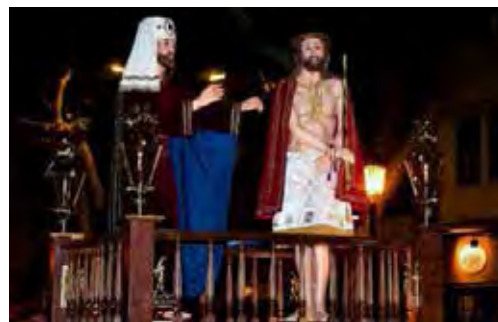
FOTO D'ANIVERSARI DELS ARMATS DEL VENDRELL

Com és tradicional el passat 14 d'abril, Divendres Sant, es va participar a la Processó del Silenci, conjuntament amb el Misteri Eccehomo de l'entitat. En acabar, a la plaça Vella, es va fer la tradicional exhibició. Volem aprofitar per donar les gràcies a la Lira Vendrellenca per cedir-nos la sala Pau Casals perquè ens poguéssim canviar i, en acabar, celebrar la tradicional xocolatada amb tots els col·laboradors. Moltes gràcies a tots!