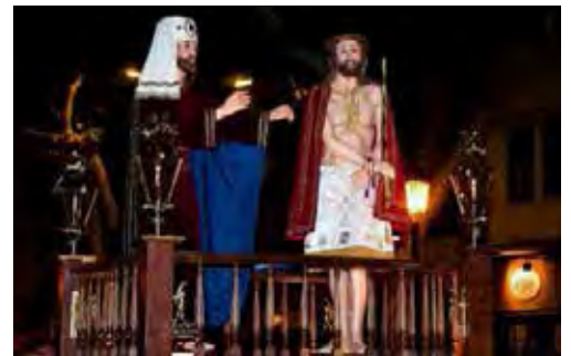
FOTO D'ANIVERSARI DELS ARMATS DEL VENDRELL

Com és tradicional el passat 14 d'abril, Divendres Sant, es va participar a la Processó del Silenci, conjuntament amb el Misteri Eccehomo de l'entitat. En acabar, a la plaça Vella, es va fer la tradicional exhibició. Volem aprofitar per donar les gràcies a la Lira Vendrellenca per cedir-nos la sala Pau Casals perquè ens poguéssim canviar i, en acabar, celebrar la tradicional xocolatada amb tots els col·laboradors. Moltes gràcies a tots!