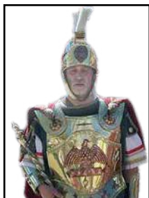
El Capità Manaies