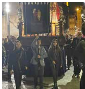
Portants del Pendó