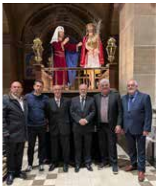
Portants del Misteri Eccehomo

Així mateix, com és tradició, els Armats del Vendrell van obrir la Processó del Silenci del Divendres Sant del Vendrell, amb la participació dels serenos i del Misteri Eccehomo de l'entitat. En acabar, a la plaça Vella, es va fer la tradicional exhibició davant d'un nombrós públic.