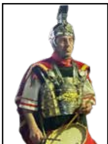
El Cap de la percussió