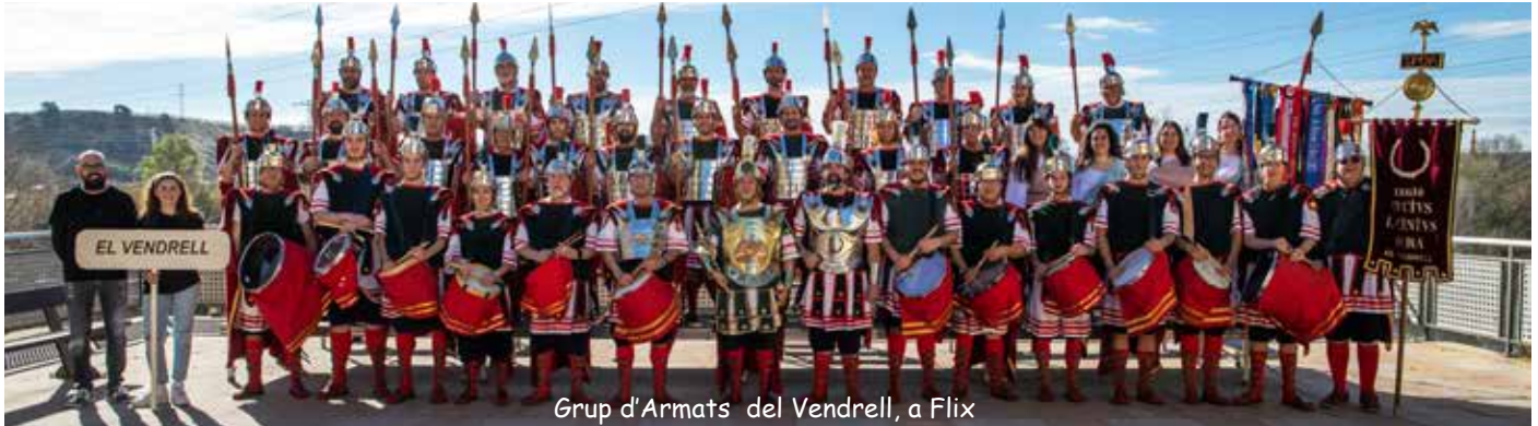
Grup d'Armats del Vendrell, a Flix

Els Armats del Vendrell van participar, el passat 26 de març de 2023, a la XXIV Trobada d'Armats de les Comarques Tarragonines, a Flix, amb la tropa al complet, gràcies a la incorporació de nous col·laboradors i col·laboradores. L'actuació, durant el recorregut i a l'exhibició final, va ser tot un èxit, atesos els aplaudiments del públic assistent. Si no hi ha cap canvi, l'edició següent se celebrarà al Pla de Santa Maria.