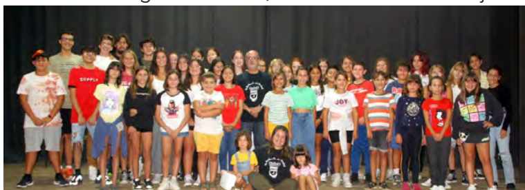
Càsting Pastorets Infantils/Juvenils 2022-2023

Enguany hi tornarà a haver càsting per als Pastorets Infantils/Juvenils. És molt important que hi assistiu, ja que serà molt interessant i important veure l'evolució dels actors i les actrius, i les possibles noves incorporacions. Tothom qui estigui interessat a fer teatre té a l'abast aquesta oportunitat. Per tant, tots els nens, nenes i joves, majors de 6 anys que vulguin participar en el càsting, cal que vinguin el dissabte 23 de setembre , a les 4 de la tarda, al Casal Familiar Parroquial. Els pares o acompanyants hauran de sortir de la sala i tornar-hi per recollir el nen o la nena una vegada hagi acabat el càsting. Prèviament, tots els nens i nenes i joves interessats, tant si han fet o fan teatre com si no n'han fet mai, cal que passin a recollir les bases del càsting el dimecres 13 de setembre, de 7 a 2/4 de 9 del vespre, a la sala d'actes Carolina Coronado de l'Asociación Cultural Extremadura. Només es lliuraran aquest dia, en aquesta hora i en aquest lloc.