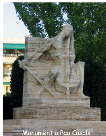
Monument a Pau Casals

Com ja és tradicional, està previst que diferents membres de la Junta dels Pastorets i dels Armats del Vendrell participin en la celebració de l'Onze de Setembre, Diada Nacional de Catalunya. A les 10 del matí es farà l'ofrena floral al monument a Pau Casals, a la plaça J.S. Bach, de Sant Salvador, per reivindicar la figura del Mestre com a lluitador i defensor dels drets dels homes i per la pau dels pobles.