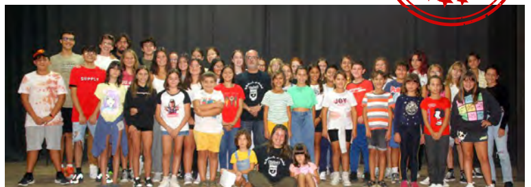
Càsting Pastorets Infantils/Juvenils 2022-2023

Cal recollir-les el dimecres, 13 de setembre , de 7 a 2/4 de 9 del vespre, a l'Asociación Cultural Extremadura. Més informació, a la pàgina interior d'aquest Butlletí.