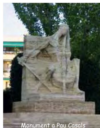
Monument a Pau Casals

Com ja és tradicional, està previst que diferents membres de la Junta dels Pastorets i dels Armats del Vendrell participin en la celebració de l'Onze de Setembre, Diada Nacional de Catalunya. L'ofrena floral es farà al monument a Pau Casals, a la plaça J.S. Bach, de Sant Salvador, per reivindicar la figura del Mestre com a lluitador i defensor dels drets dels homes i per la pau dels pobles.