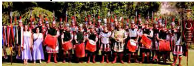
Catalunya: 1 de maig de 2025

La Tropa va participar en la Trobada d'Armats de Catalunya, a la Seu d'Urgell, amb un gran èxit, com van mostrar els aplaudiments que van rebre per part del públic assistent. Com a deferència, el dinar de germanor va anar a càrrec de l'entitat.