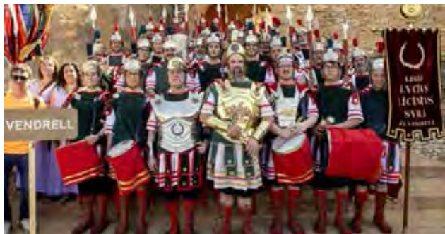
Puigpelat: 6 d'abril de 2025

Donem les gràcies a les persones que van posar desinteressadament el seu cotxe, així com al Drac de Foc el Cabrot per cedir-nos el remolc per traslladar tots els estris.